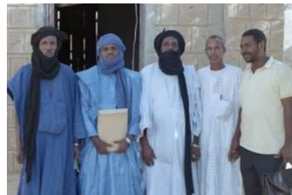
La municipalité de Ber

(Cinéma Numérique Ambulant), réseau international d'associations qui gère dix unités mobiles de projection au Bénin, au Burkina Faso, au Mali, au Niger et en France.